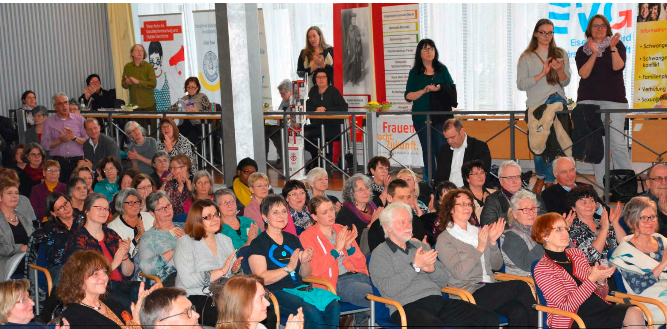
Ausstellung Frauentag 2018