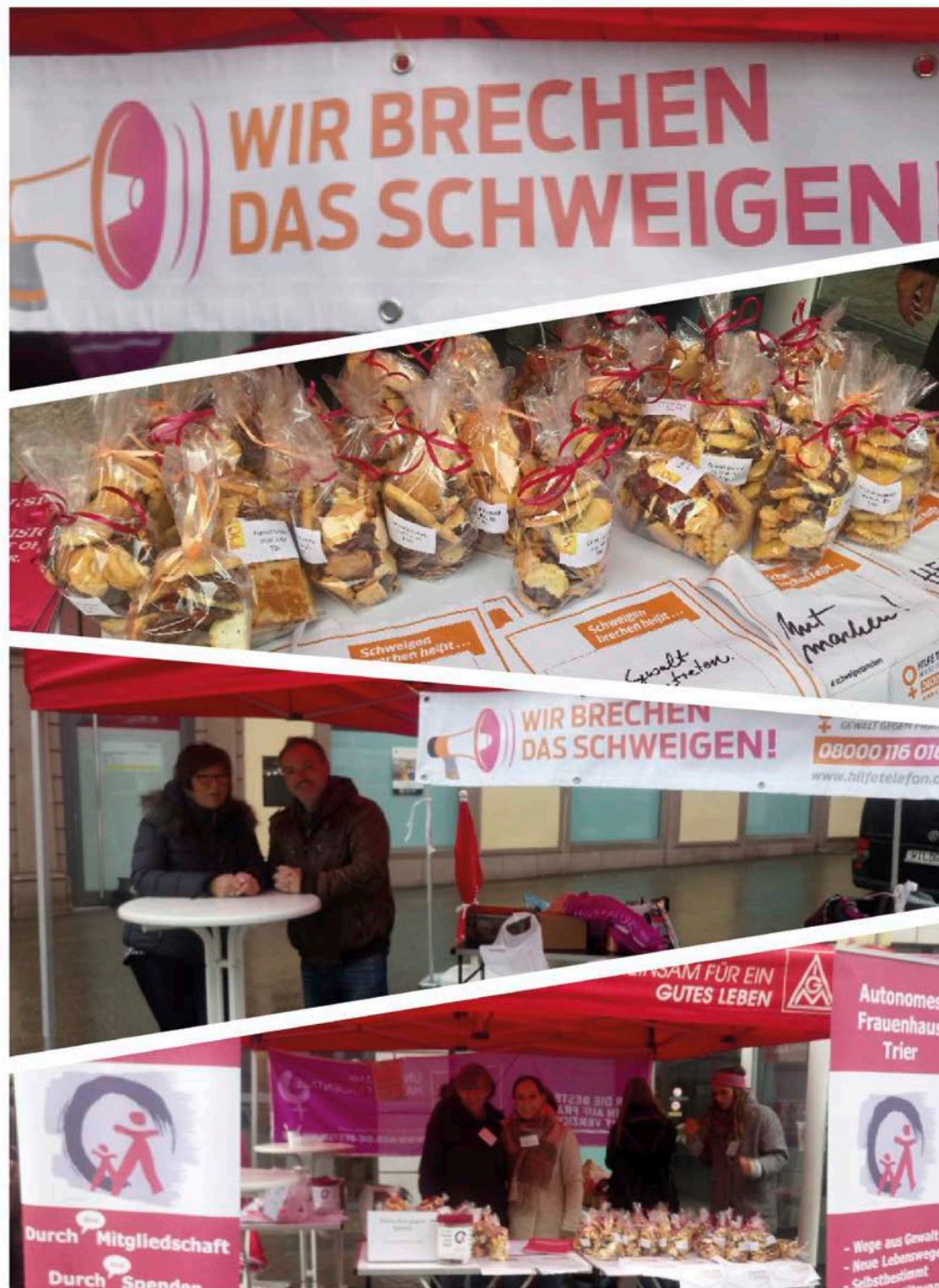
Impressionen vom Infostand ‚Nein zu Gewalt an Frauen‘ November 2018