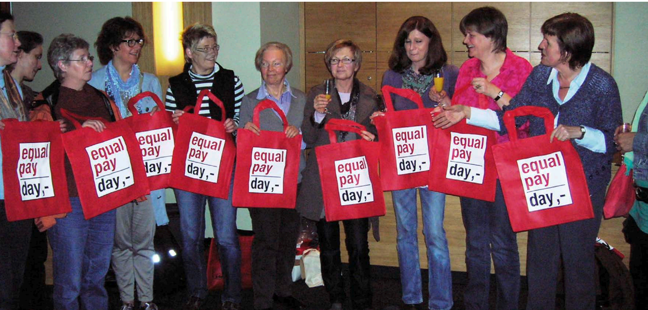
Filmvorführung im Kino Broadway Trier zum Equal-Pay-Day