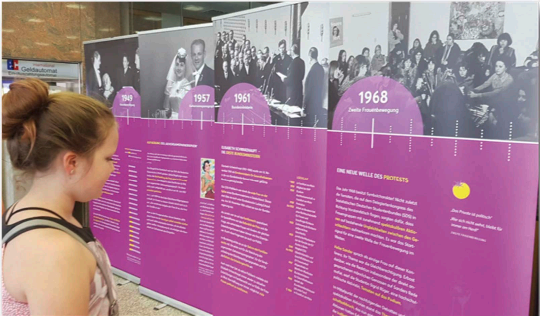
Wanderausstellung ‚100 Jahre Frauenwahlrecht in Deutschland – Meilensteine der Geschichte‘ in Schweich