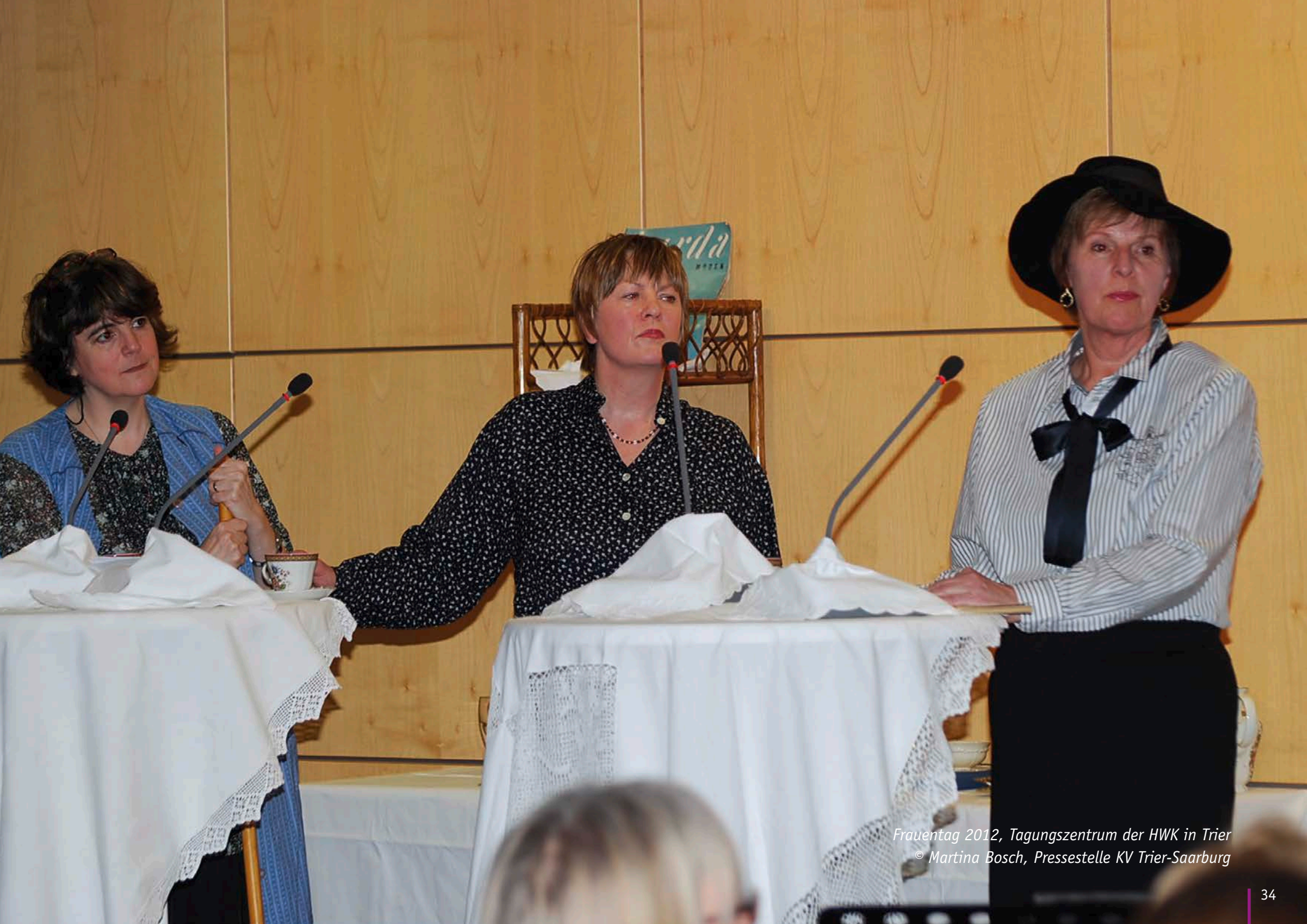
Frauentag 2012, Tagungszentrum der HWK in Trier