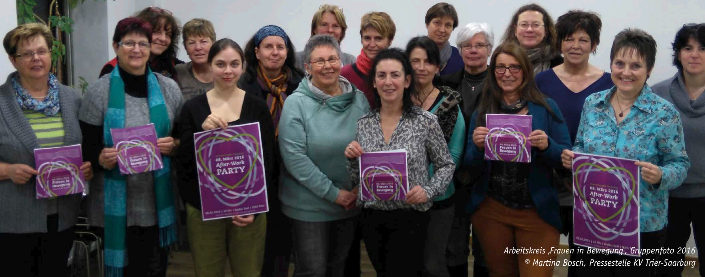
Arbeitskreis „Frauen in Bewegung“, Gruppenfoto 2016