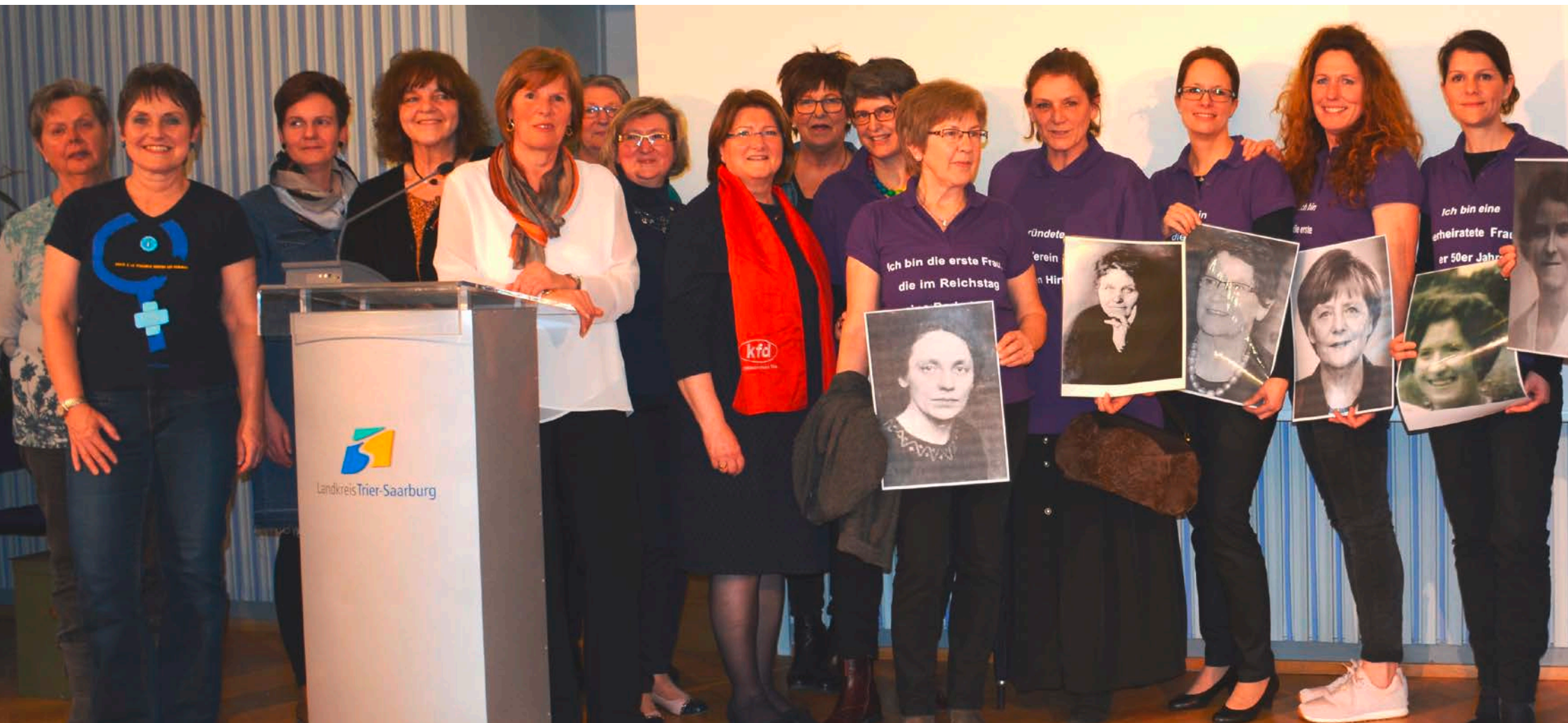
„Frauen die Geschichte schrieben“ 2018