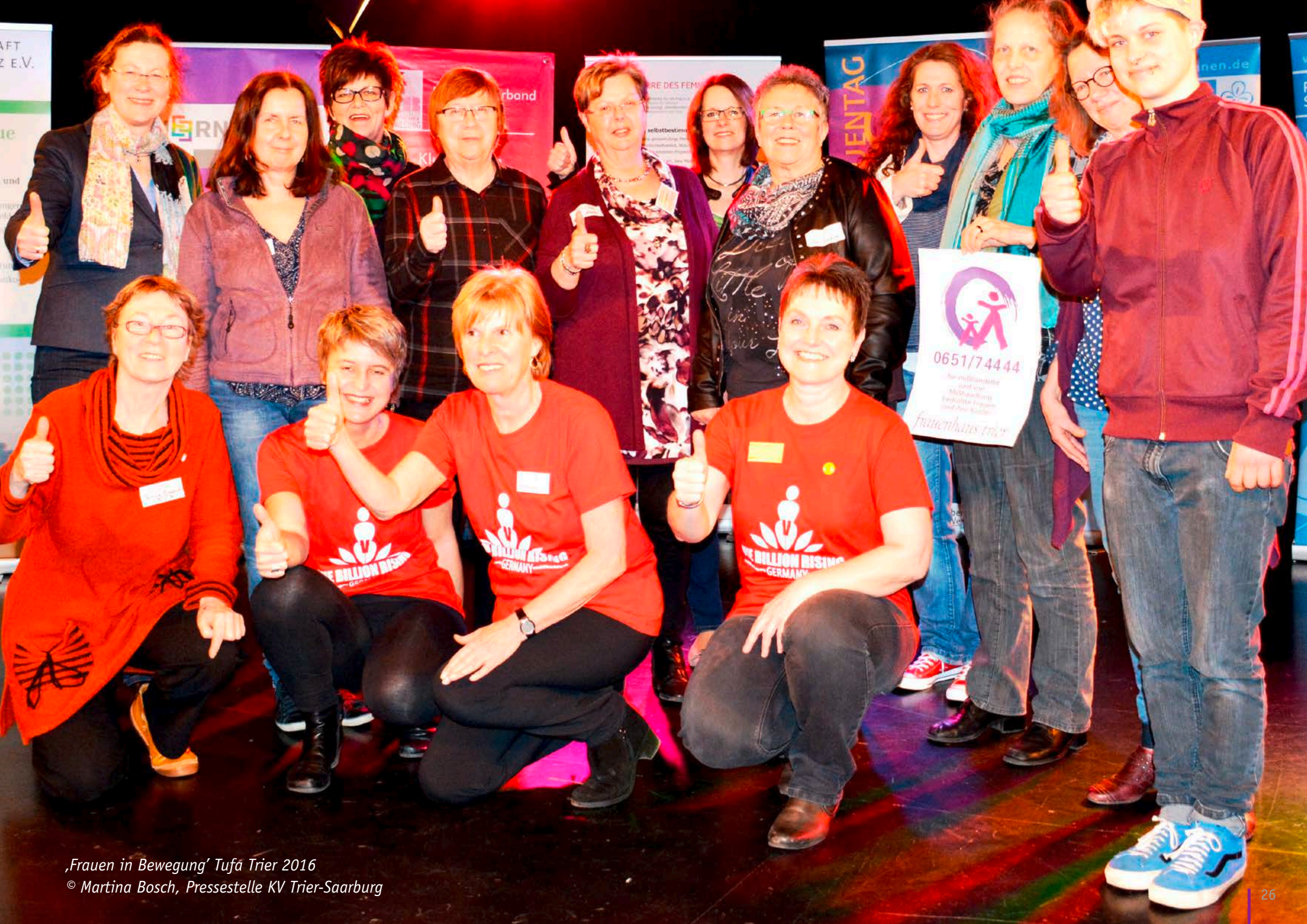
„Frauen in Bewegung“ Tufa Trier 2016