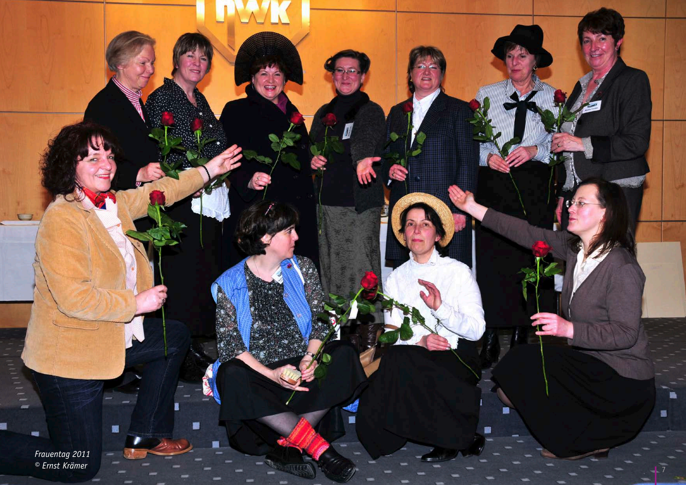
Frauentag 2011