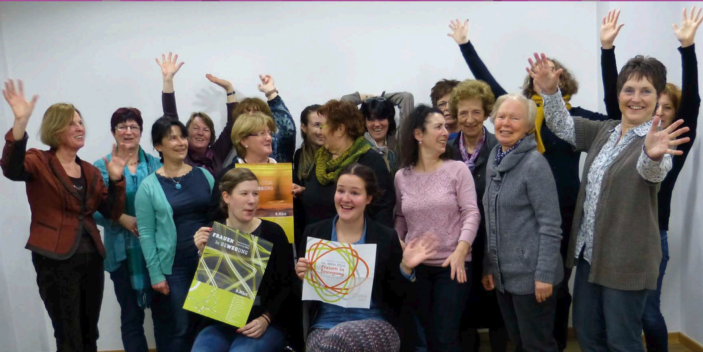
Studentinnen der FH Trier entwickelten ein Logo für unseren Arbeitskreis, Oktober 2014